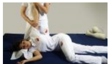
Sette Giorni tra Arte e Scienza