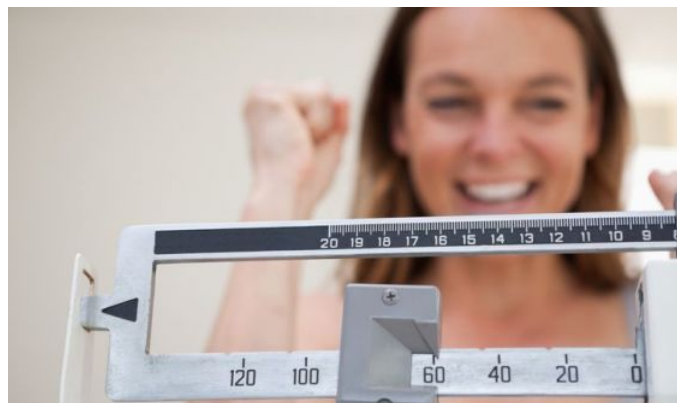
Di nuovo in forma in 7 mosse