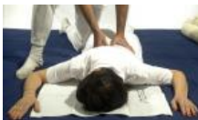
Che cos'è lo Shiatsu