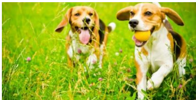
In forma con Fido