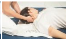
Tanti eventi in tutta Italia